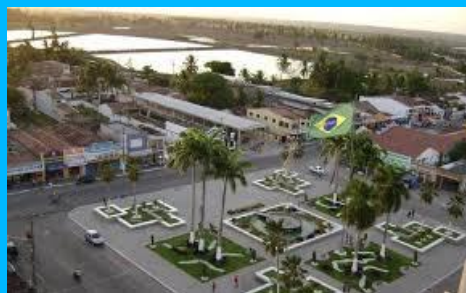
Praça da cidade