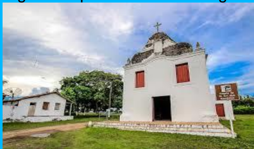
Capela de Cunhaú

Hoje a o município de Canguaretama é uma das principais potencialidades turísticas do estado em relação à importância histórica e cultural do Engenho Cunhaú, cenário do primeiro massacre registrado por intolerância religiosa no estado do Rio Grande do Norte.