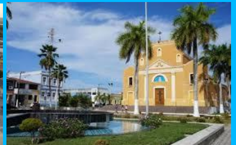
Matriz de NS da Conceição