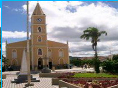
Matriz de São Sebastião