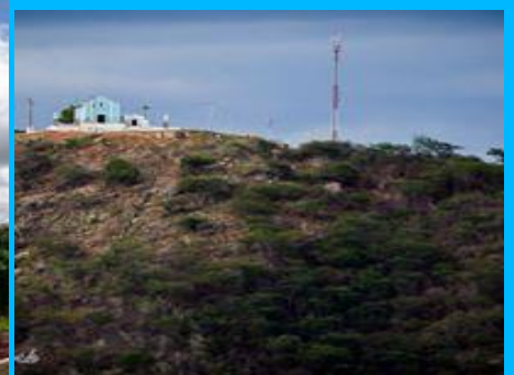
Monte Nossa Senhora das Graças