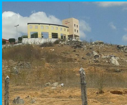
Mirante de Passa e Fica